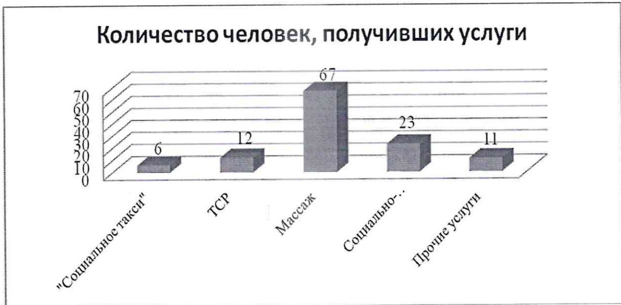
Рисунок 2 – Количество человек, получивших дополнительные и платные услуги в 2022 году