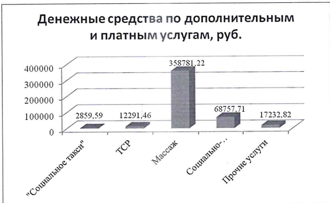
Рисунок 3 – Сумма денежных средств, полученных по дополнительным и платным услугам в 2022 году

Согласно Административному регламенту предоставления государственной услуги "Предоставление инвалидам технических средств реабилитации, включенных в реабилитационный перечень технических средств реабилитации, предоставляемых инвалиду", 63 инвалида получили 111 технических средств реабилитации (в 2021 году 96 инвалидам выдано 161 ТСР).