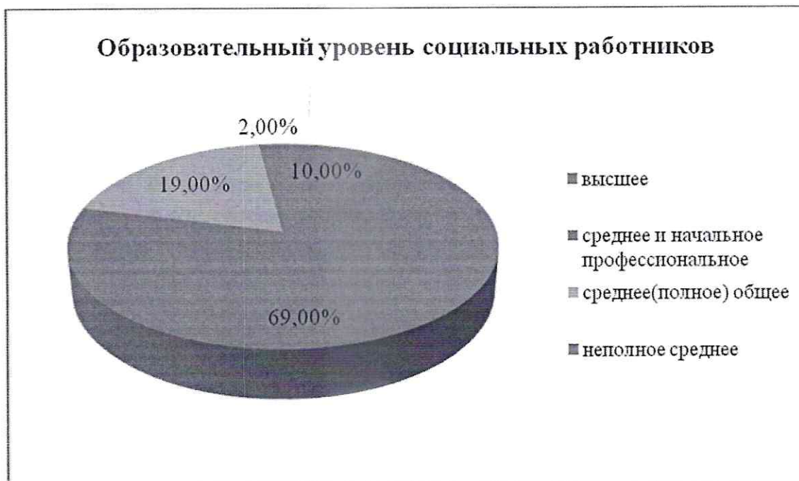
Рисунок 1 – Образовательный уровень социальных работников

Вывод по диаграмме: высшее образование имеют 10 человек (10%), среднее профессиональное и начальное профессиональное – 96 человек (69%), среднее (полное) общее образование – 19 человека (19%), неполное среднее образование – 2 человека (2%). Таким образом, рекомендуется поднимать уровень образования социальных работников за счет прохождения ими курсов повышения квалификации, переподготовки, стажировки, самообучения и участия в профессиональных конкурсах.